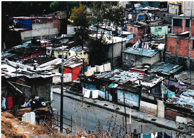
Teilansicht von Las Aguilas

Die Mexikogruppe Kahlgrund und die Verantwortlichen in Mexiko sichern Ihnen zu, dass alle Spenden ausschließlich zum Wohle der Bewohner von Las Aguilas verwendet werden.